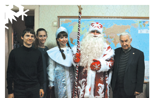
На ТЭФ поддерживается традиция проводить общефакультетский новогодний праздник.