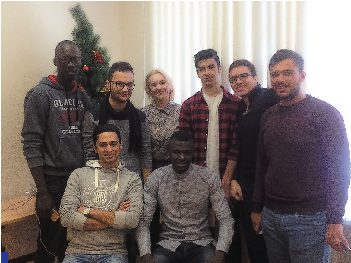
Молодые люди из разных стран планируют получить образование в СамГТУ.