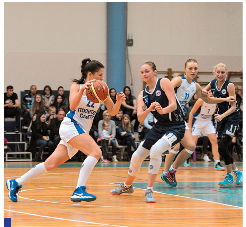
Развитие баскетбольного клуба «Политех – СамГТУ» – один из главных спортивных проектов опорного вуза.