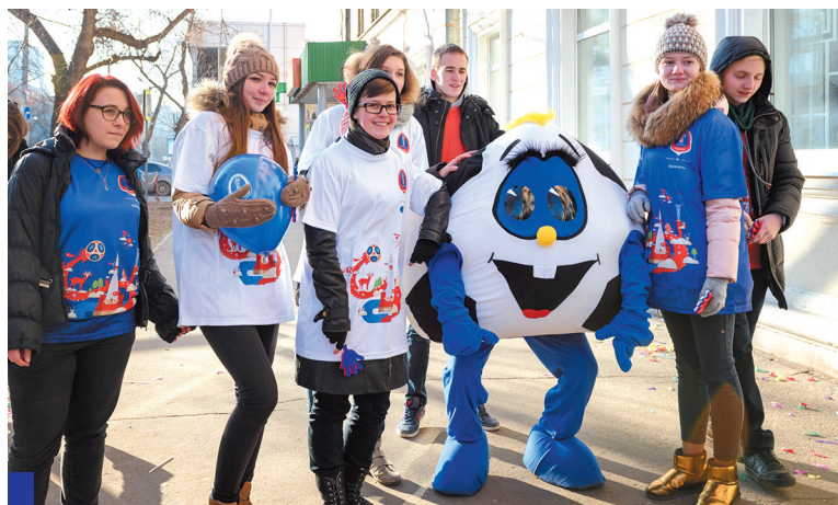
Студенты Политеха приняли активное участие в открытии Центра привлечения и подготовки городских волонтеров.