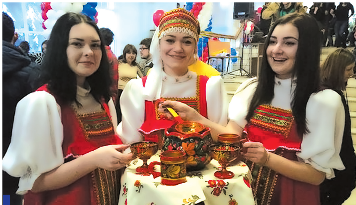
В СамГТУ в Татьянин день студентов по традиции угощают медовухой собственного производства.

сийского университета. «Отцом» оно было фаворит Елизаветы, 28-летний красавец генерал Иван Шувалов. Основание университета стало подарком не только России, но и горячо любимой матушке