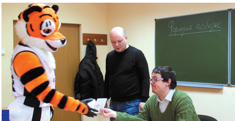
Джоуль изо всех сил старается хорошо учиться и помогать своей команде.

Талисман БК «Энергия – СамГТУ» закрывает сессию и снимается в кино