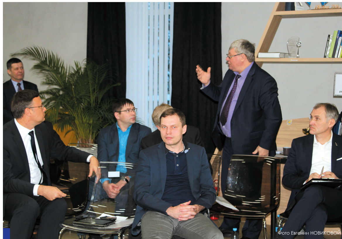
Неформальный диалог представителей власти и университета.

СамГТУ принял участие в проектной сессии Агентства стратегических инициатив